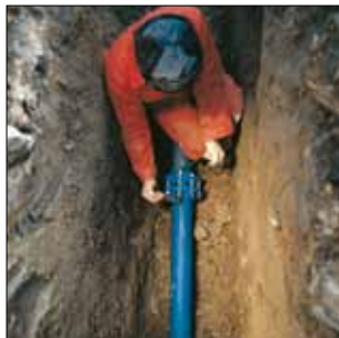
Montering af AVK Combi-flanger

- både til trækfaste og ikke trækfaste forbindelser på støbejernsrør (DC).