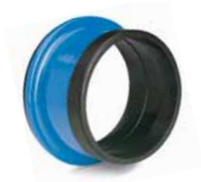
Combi-flange med standardpakning