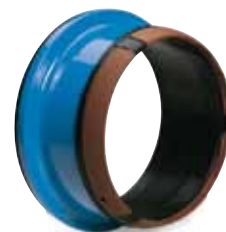
Combi-flange med trækfastpakning